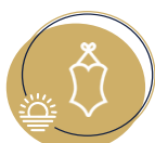
Maillot de bain