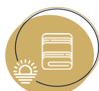
Serviette de bain