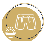
Short de bain