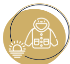
Manteau Coupe vent